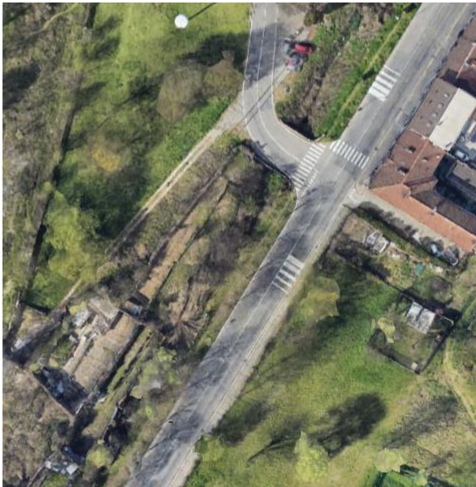
Vista impianto Google maps