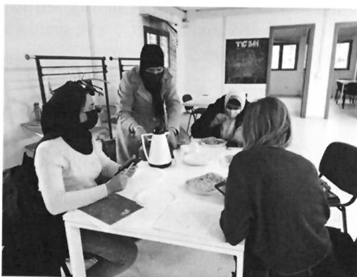
Il corso di italiano per donne dell'associazione Manal