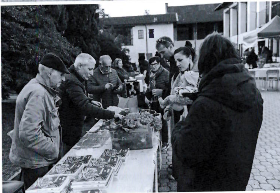
Acqua Farm Cascina Falchera 2023

4.v, 40.v, 4/2012A/072.fra, 003.arm, 15.vf, 5.nd, 2.a