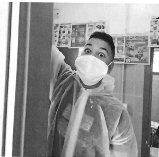
I lavori svolti al Falklab con ragazz* e le associazioni

4.v, 40.v, 4/2012A/072.fra, 003.arm, 15.vf, 5.nd, 2.a