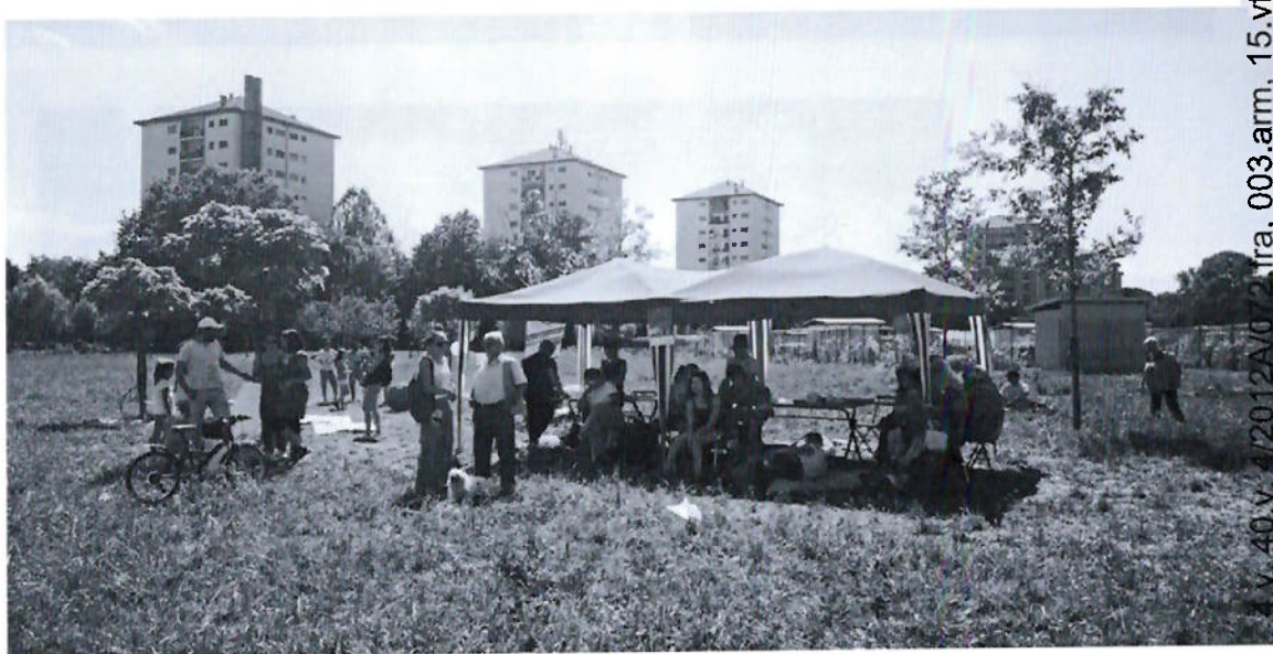
Giornata degli Aquiloni al Parco Laghetti Falchera con i bambini dell'ospedale Sant'anna accompagnati da Casa UGI - giugno 2019

Arrivo: AOO 003, N. Prot. 00001115 del 05/02/2026