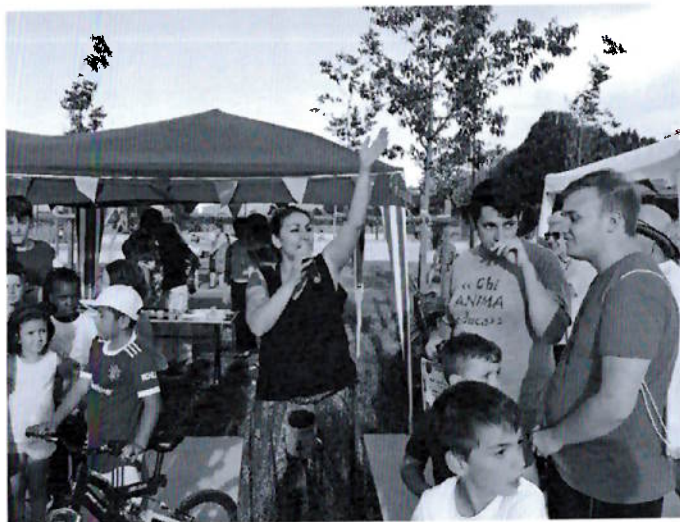
Festa d'Estate al Parco Laghetti 2022

4.v, 40.v, 4/2012A/072.fra, 003.arm, 15.vf, 5.nd, 2.a