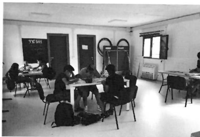
Il doposcuola del Provaci Ancora Sam