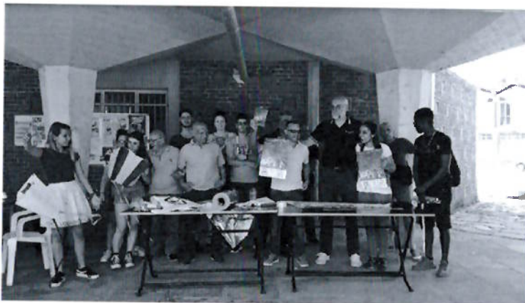
Laboratorio di costruzione di aquiloni in piazza Astengo, all'Oratorio San Pio X e al centro di protagonismo giovanile El Barrio - 2019.(Progetto Margini di Coesione in collaborazione con Gruppo Abele)

4.v, 40.v, 4/2012A/072.fra, 003.arm, 15.vf, 5.nd, 2.a