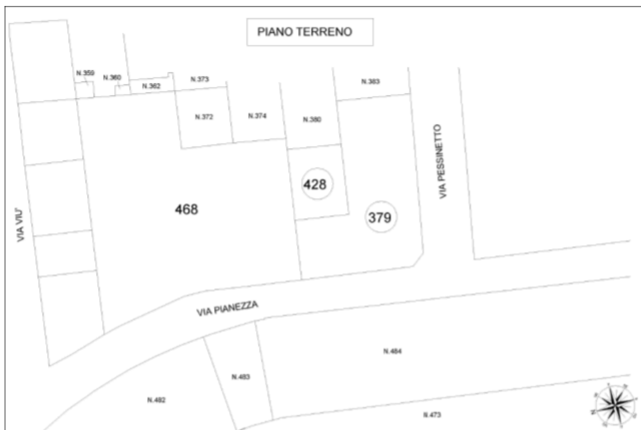
Foglio 1156, particelle 379 e 428 – Stralcio planimetria C.T. – Non in scala