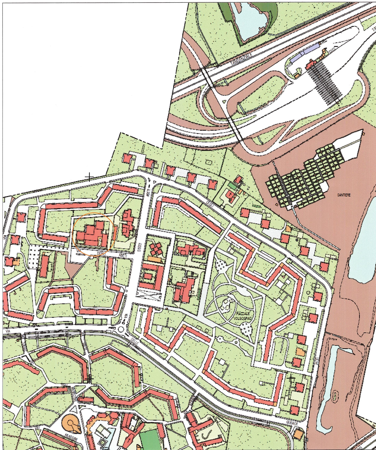
ESTRATTO DA P.R.G. Scala 1: 5000