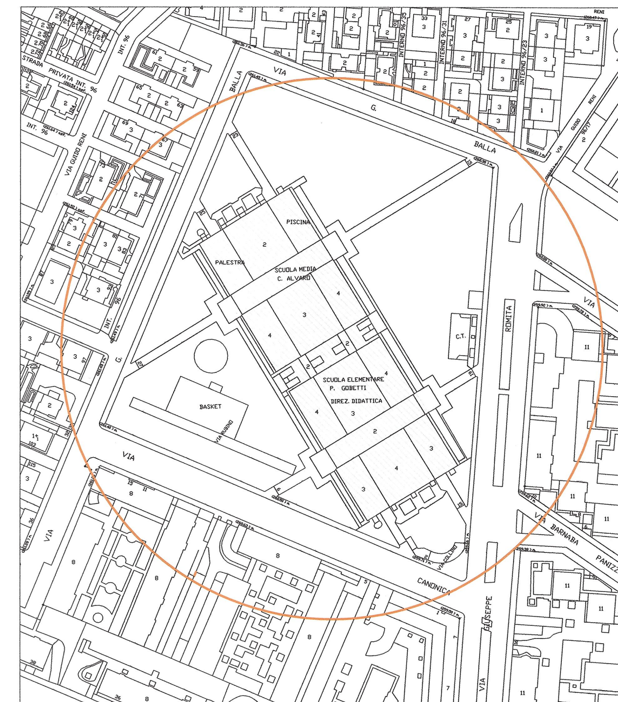
CARTA TECNICA Scala 1: 1000