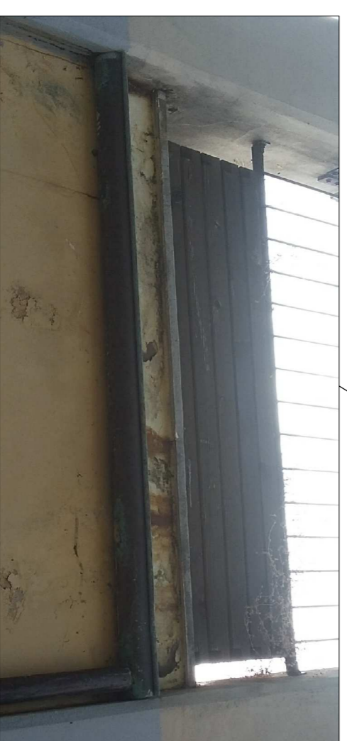
L'acqua percola al di sotto della pavimentazione, colando sulla facciata provocando distacchi di intonaco e depositi di sedimenti

Rimozione e sostituzione di grondate e pluviali di raccolta acque dal terrazzo e dalla passerella