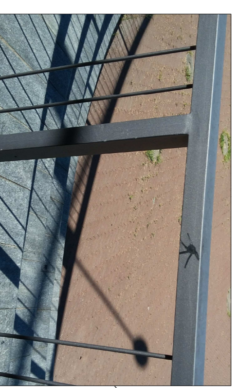
Integrazione di bacchette e sostituzione localizzata della ringhiera esistente