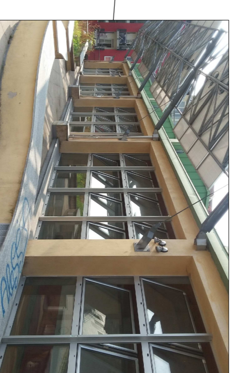
Infiltrazione di acqua dai serramenti in facciata (localizzati principalmente nella specchiatura centrale)