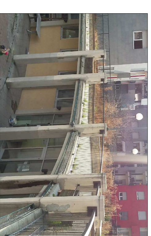
Piantumazioni non attecchite e danni dell'intonaco nella fascia frontale del terrazzo