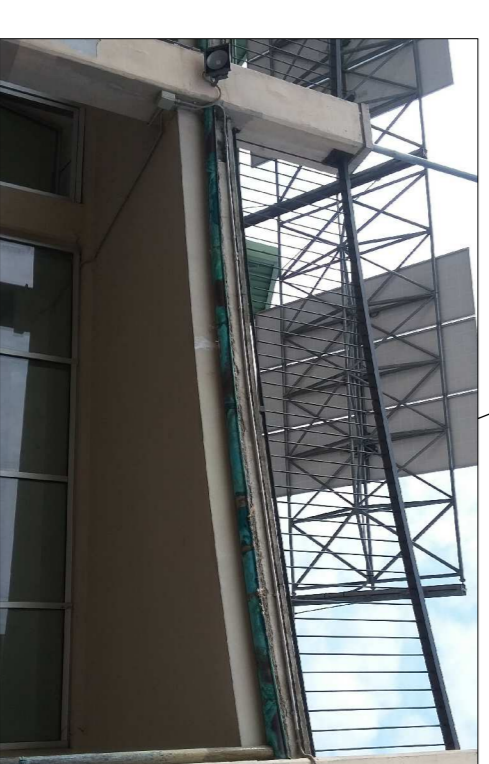
Danni provocati dall'infiltrazione di acqua al di sotto della pavimentazione del terrazzo