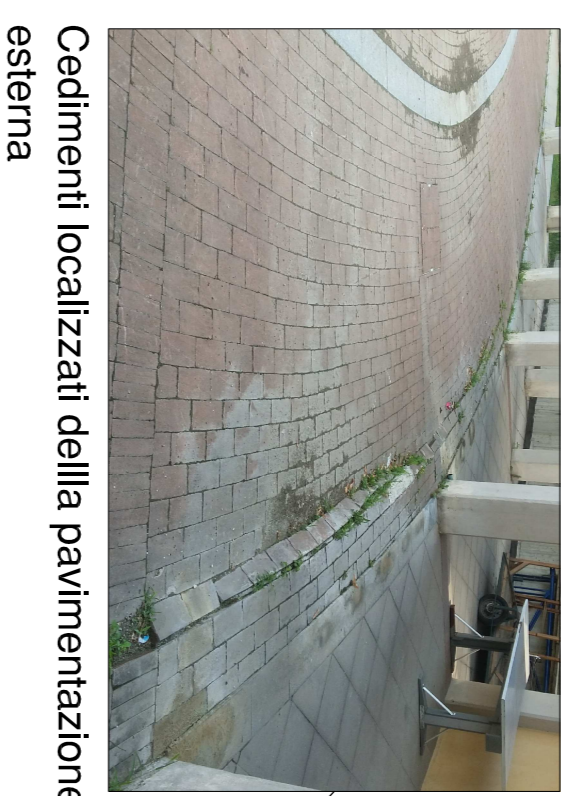
Cedimenti localizzati della pavimentazione esterna

TERRAZZO: - LISCIVATURA DEL PIANO DI POSA, POSA GUAINA IMPERMEABILE E POSA PASTRELLONI CON RIFACIMENTO DEL GIUNTO - INSTALLAZIONE INTONACO NELLE FASCE MARCAPIANO DEL TERRAZZO - INTERAZIONE DI TERRENO VEGETALE E PIANTEGGIAMENTO NUOVE SPECIE ARBUSTIVE SERRAMENTI - SUB-VERTICALI NELLA PALESTRA: POSA DI GUAINA IMPERMEABILE, REVISIONE E SIGILLATURA DEI GIUNTI, POSA NUOVA SCOSSALINA - FACCIATA/AFFACCIO SU TERRAZZO: REVISIONE E SIGILLATURA DEI GIUNTI - PAVIMENTAZIONE ESTERNA: - POSA DI NUOVO STRATO DI ALLETTAMENTO COSTIPATO CON RETE ELETTROSALDATA E INGHISSAGGI ALLA TRAVE DI BORDO - POSA DEI PASTRELLONI - OPERE DA LATTOINERRE: - SOSTITUZIONE DI GRONDAIE E PLUVIALI DAL TERRAZZO AL PIANO TERRA IN ACCIAIO INOX CON PASTRELLONI - INSERIMENTO DI SCOSSALINA DI PROTEZIONE FRONTALINI SOALIO - INSERIMENTO PLUVIALI DAL PIANO COPERTURA PALESTRA AL TERRAZZO IN ACCIAIO INOX - INTERAZIONE DI TERRENO VEGETALE E PIANTEGGIAMENTO NUOVE SPECIE ARBUSTIVE - SOSTITUZIONE BACCHETTE MANCANTI NELLA RINGHIERA A DELIMITAZIONE DELLA ZONA POGGA - SOSTITUZIONE CONTROSOFFITTO DANNEGGIATO DA INFILTRAZIONI D'ACQUA (SALA PSICOMOTORICITA' PIANO TERRENO) - RINZAFFO, INTONACO INTRADOSSO SOALIO TERRAZZO (ZONA GIUNTO)