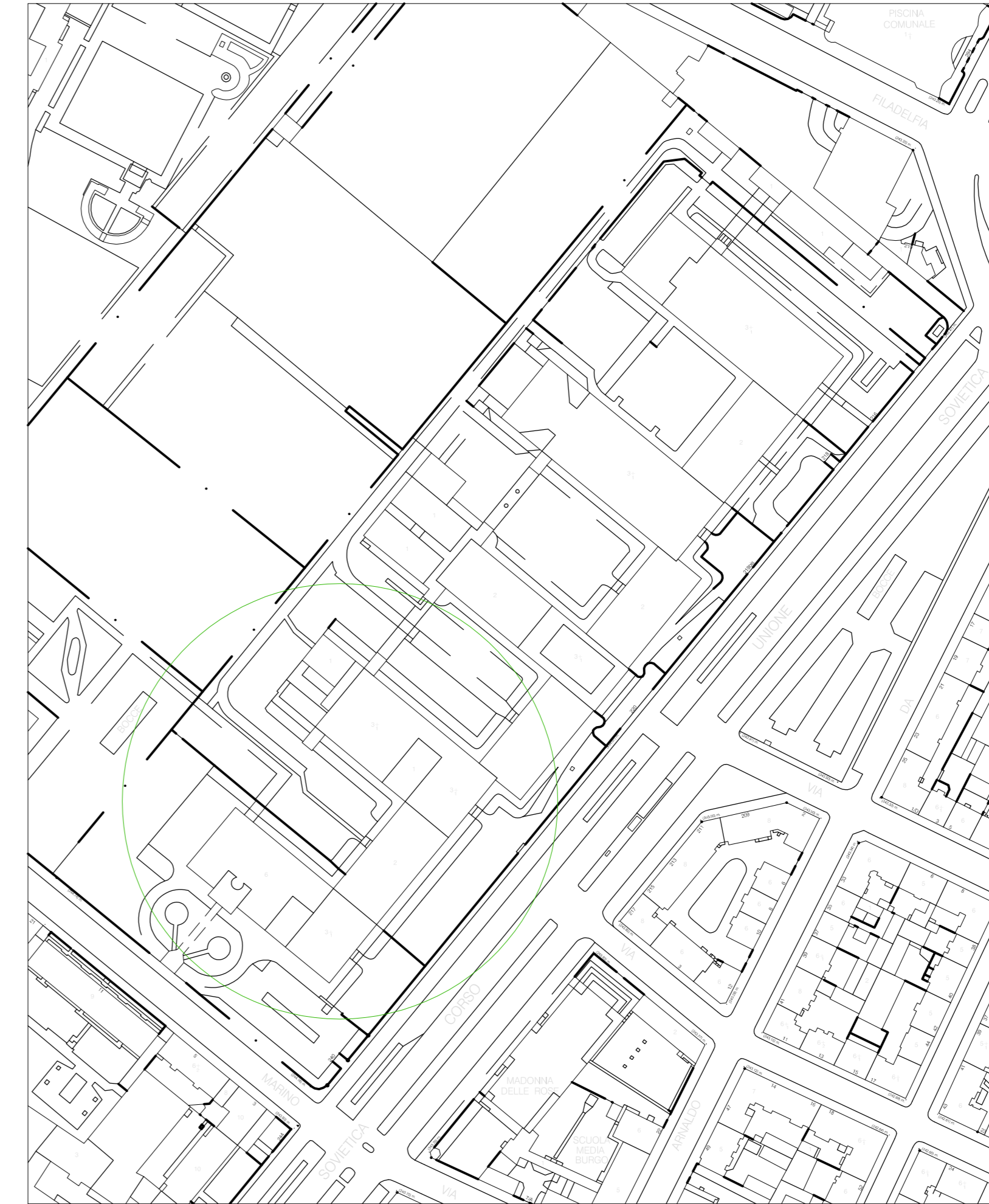
ESTRATTO CARTA TECNICA