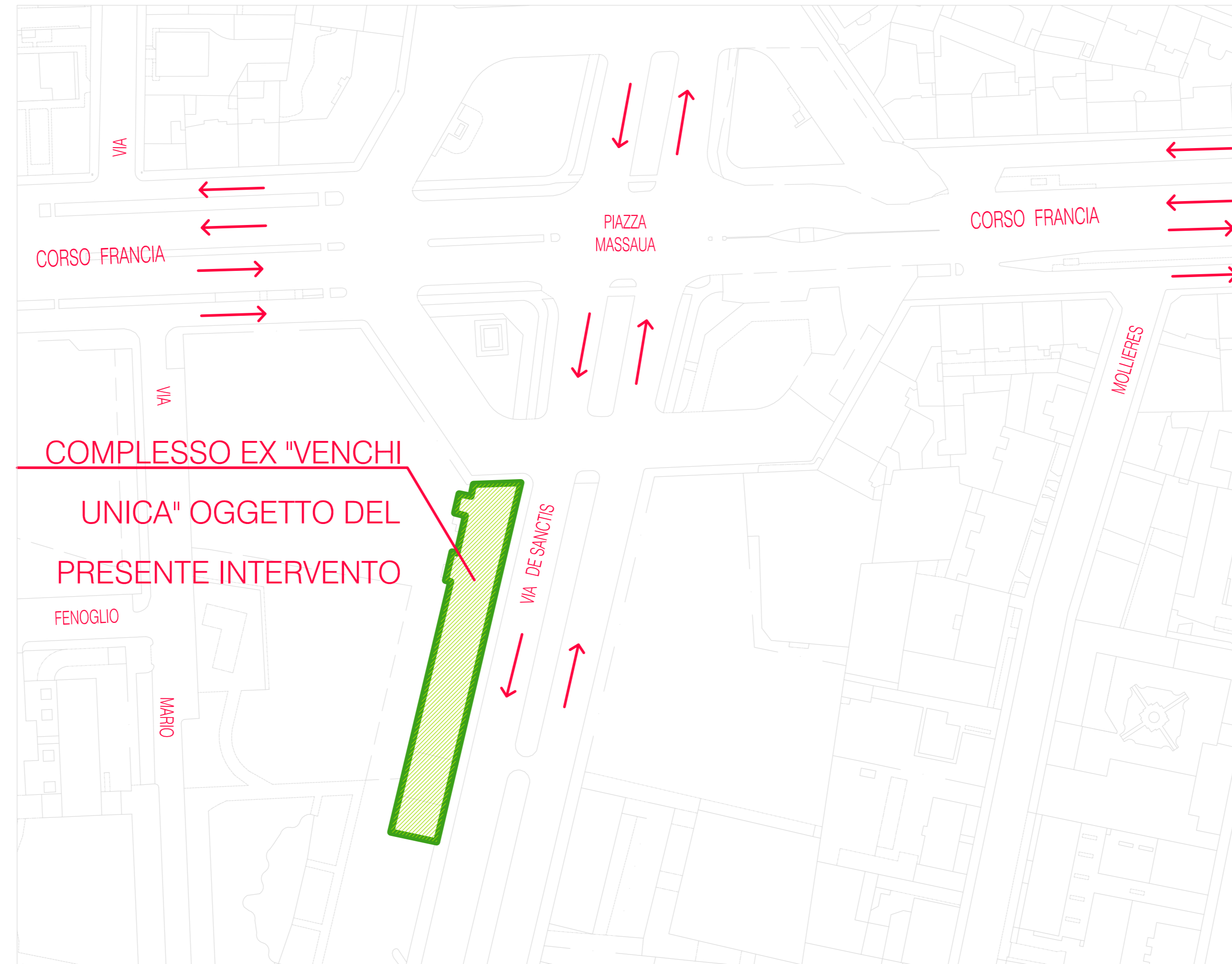
PLANIMETRIA GENERALE scala 1:1000