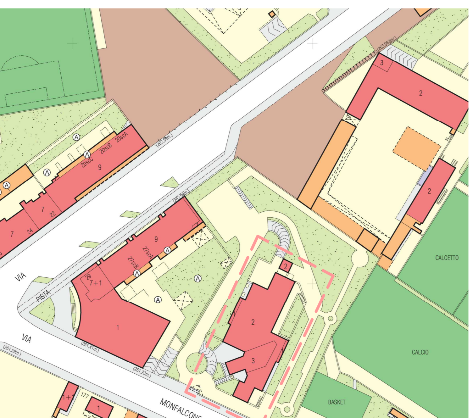
Carta Tecnica scala 1:1000