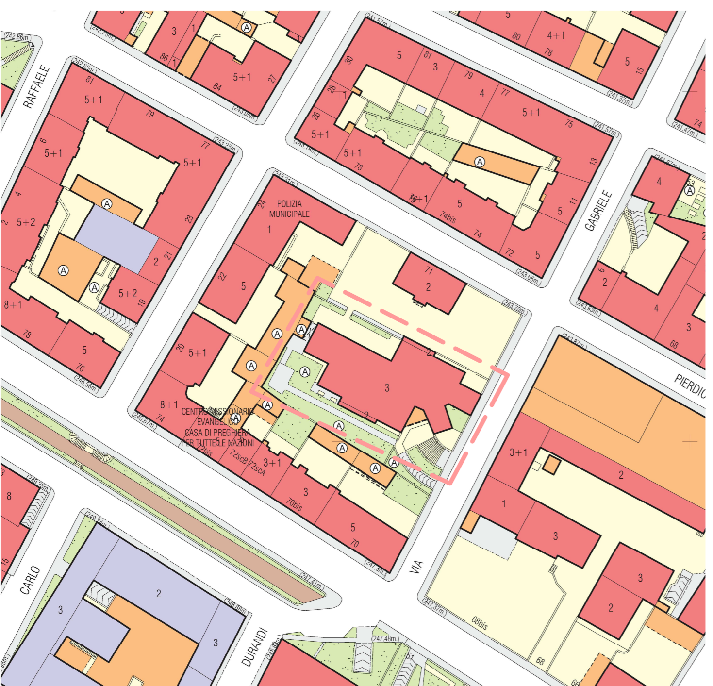
Carta Tecnica scala 1:1000