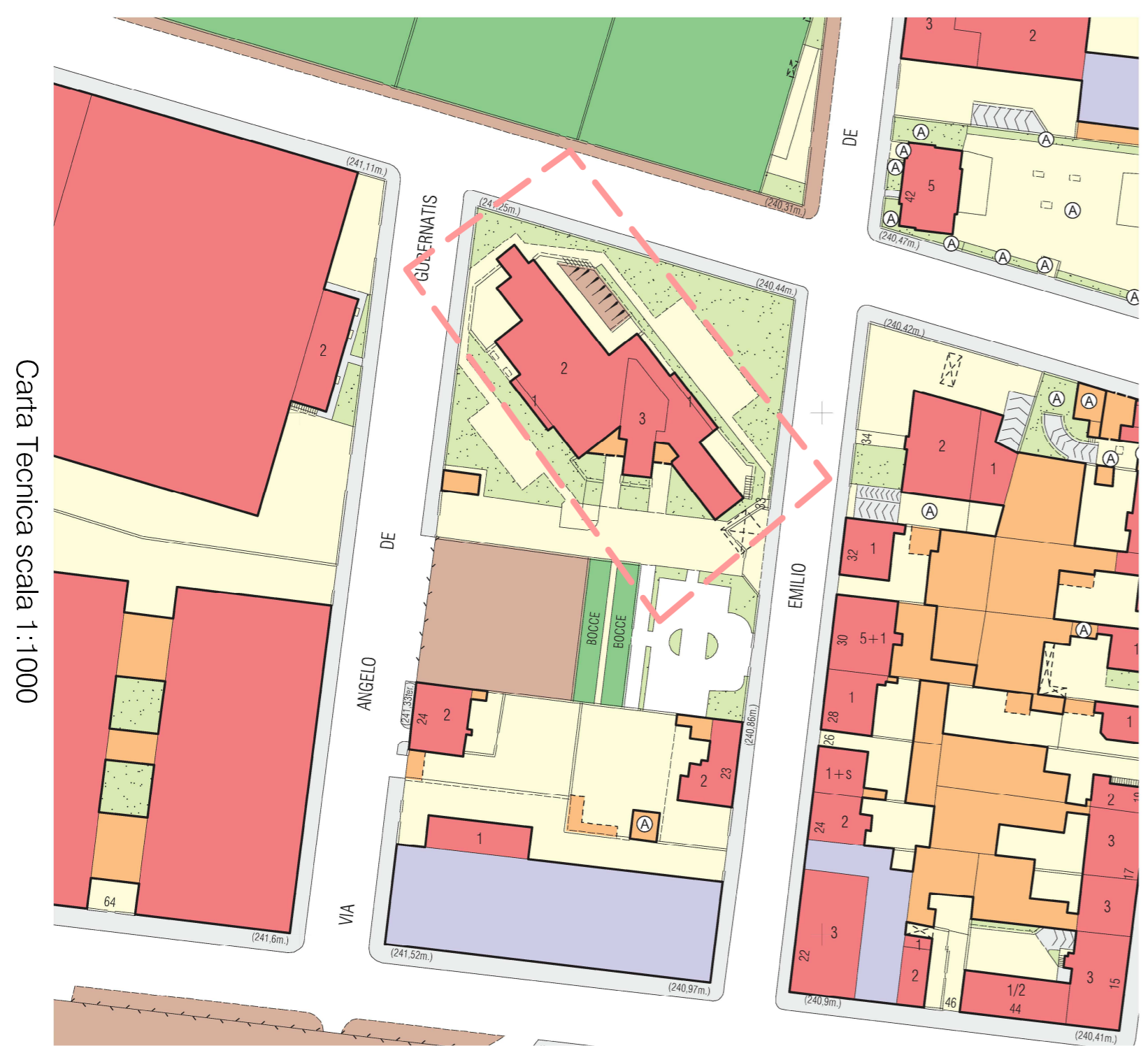
Carta Tecnica scala 1:1000