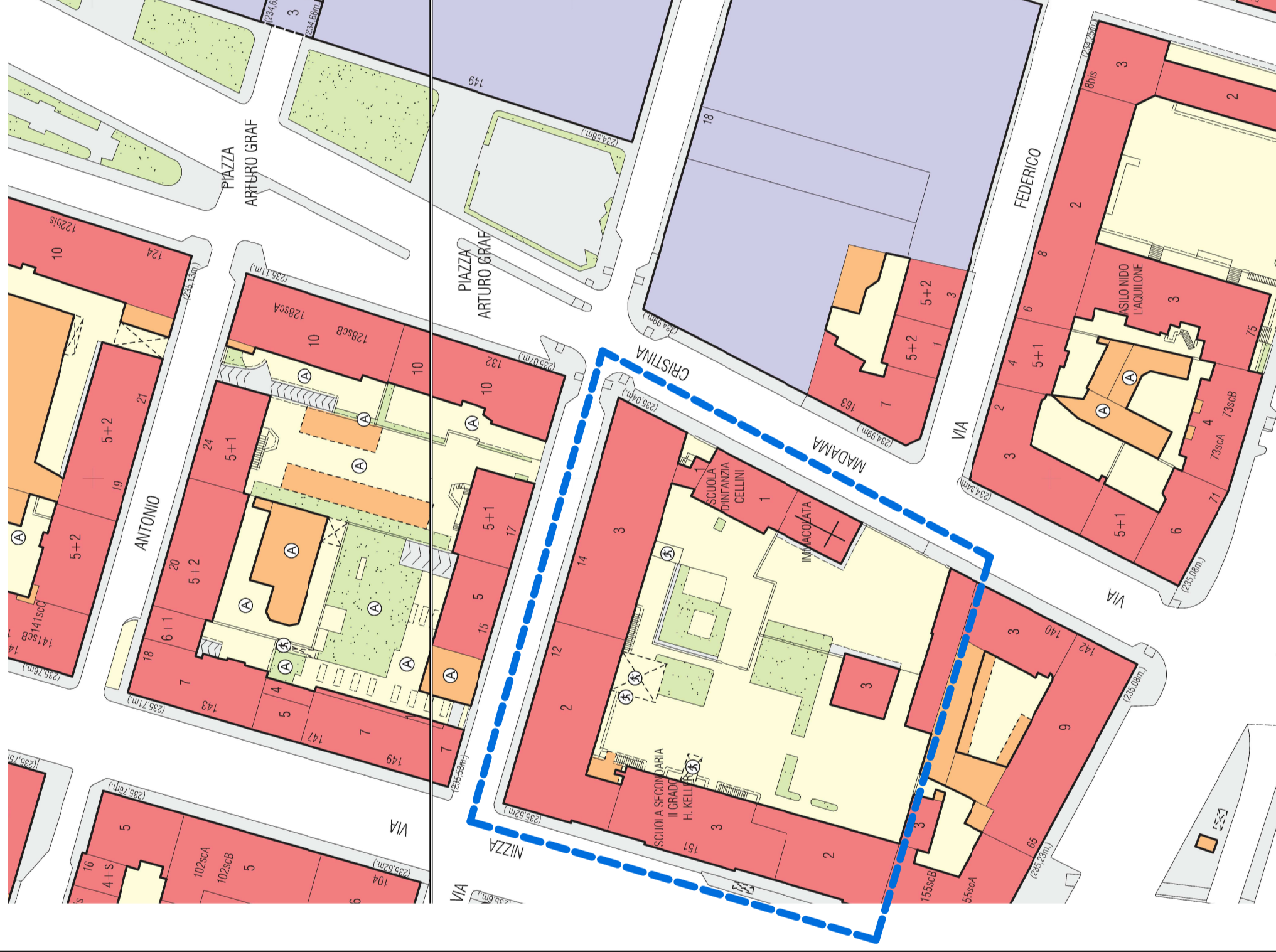
Carta Tecnica scala 1:1000