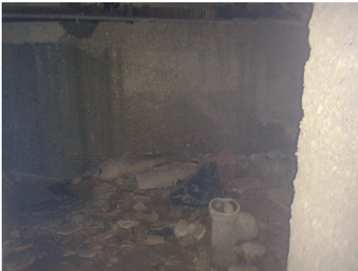
Interrato fabbricato "C".