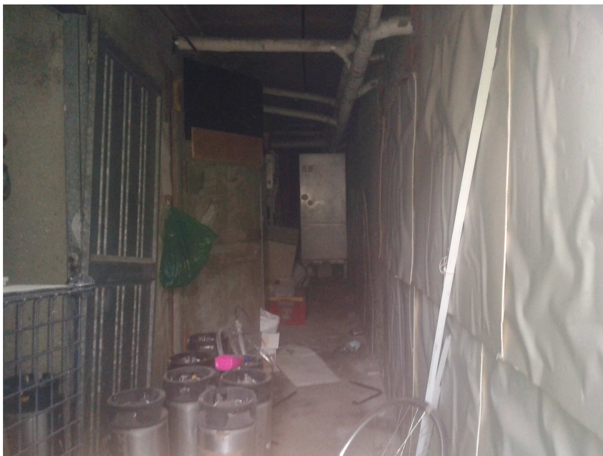
Interrato fabbricato "C".