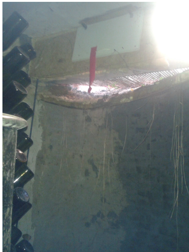
Interrato fabbricato "C".