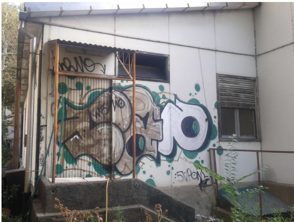
fabbricato "C" lato via Frejus