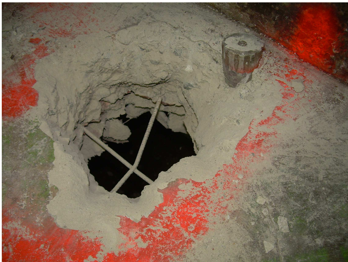
Saggio solaio calpestio fabbricato "B"