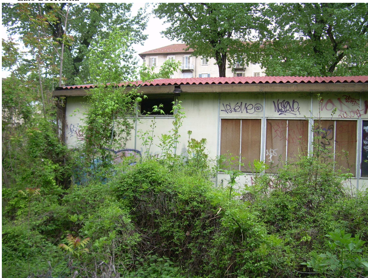
Fabbricato B lato Bocciofila