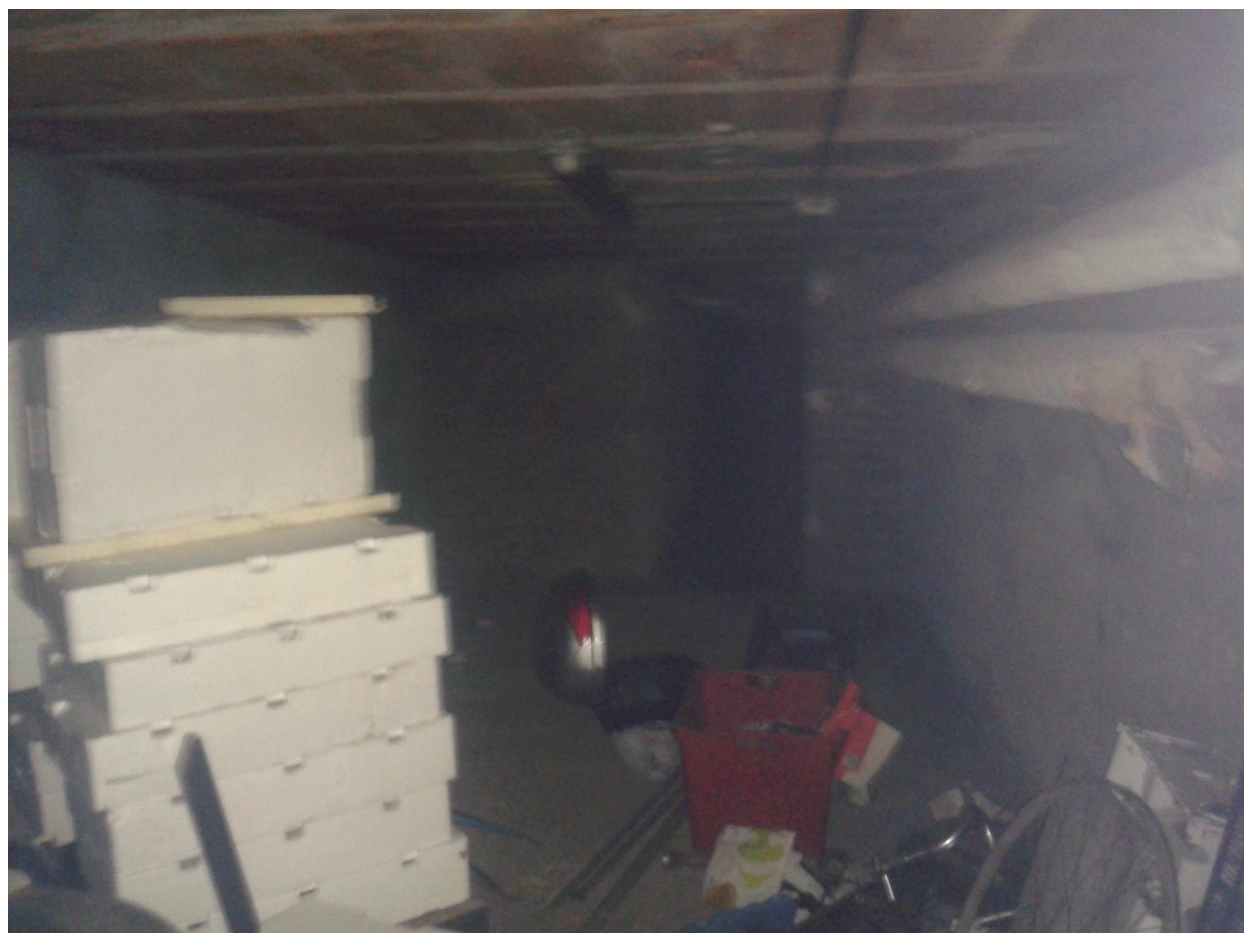
Interrato fabbricato "C".