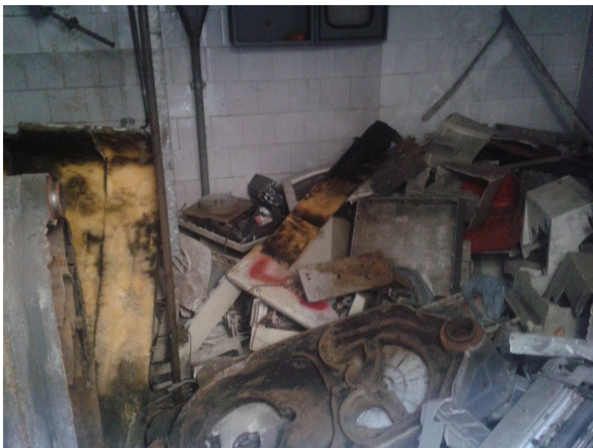
Ex Centrale Termica fabbricato "C"