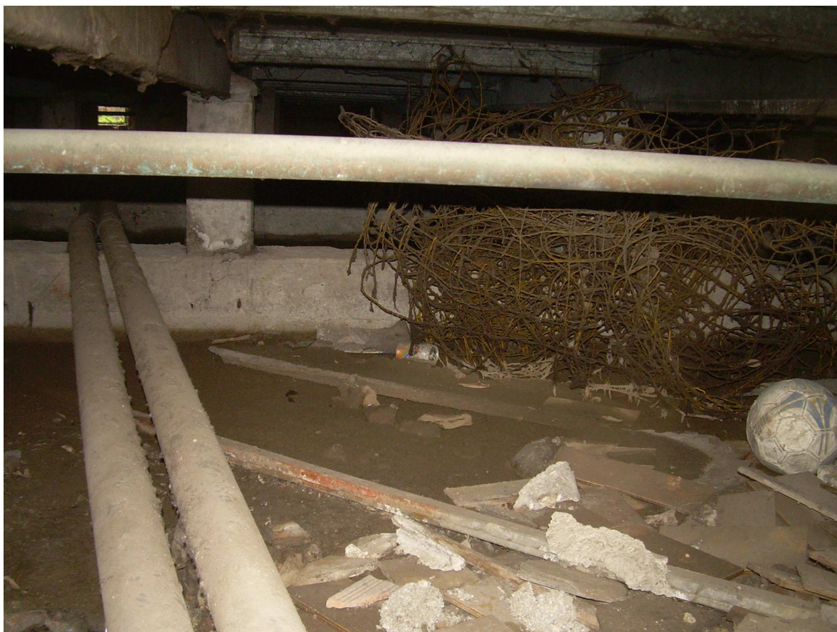
Intercapedine sotto solaio calpestio fabbricato "B"