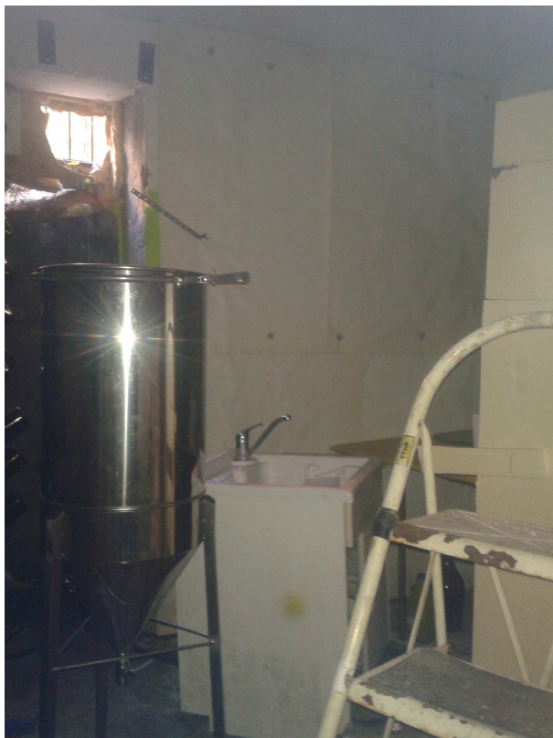
Interrato fabbricato "C".