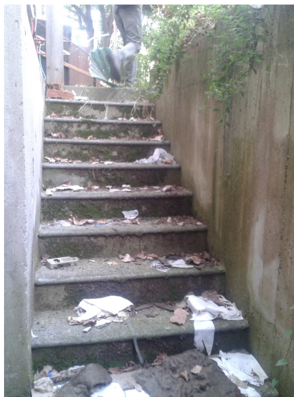
Scala e accesso - Ex Centrale Termica fabbricato "C"