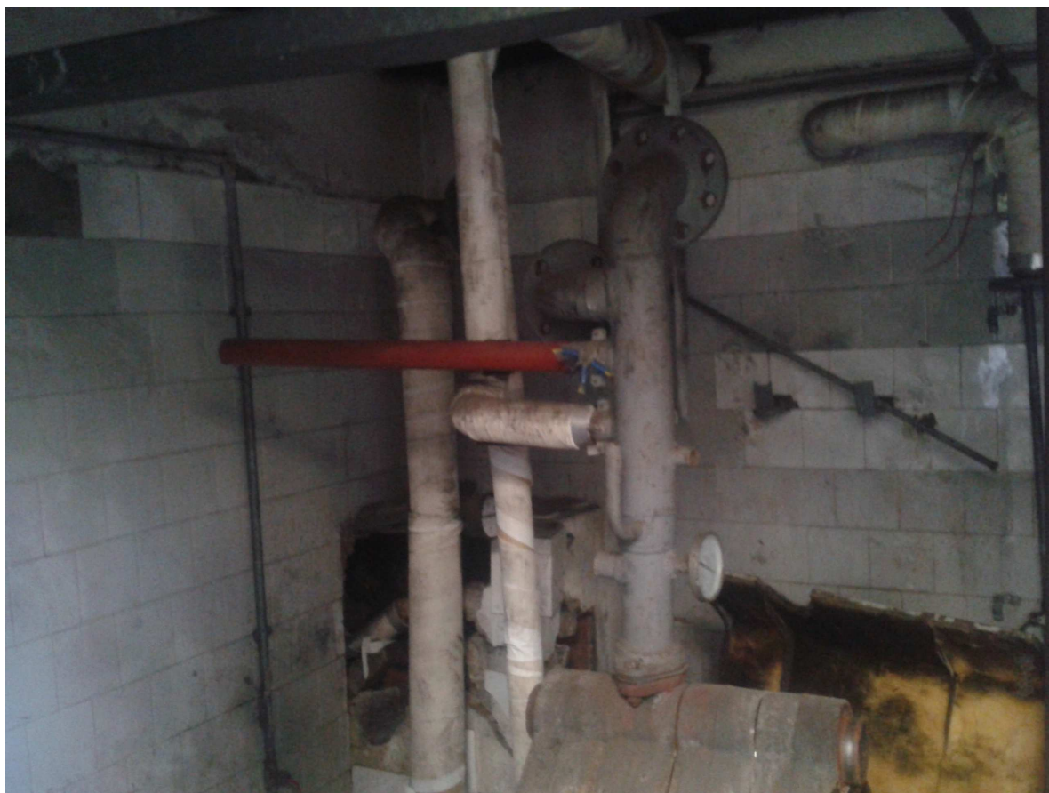
Ex Centrale Termica fabbricato "C"