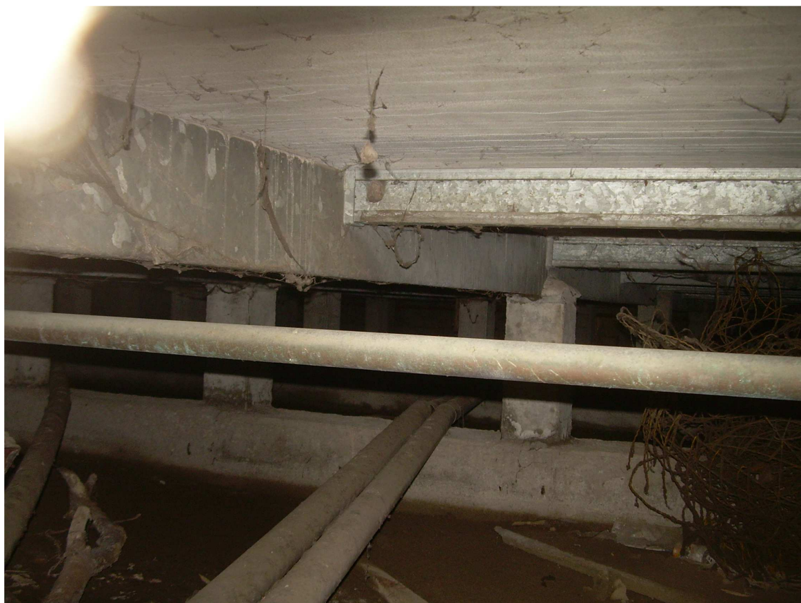
Intercapedine sotto solaio calpestio fabbricato "B"