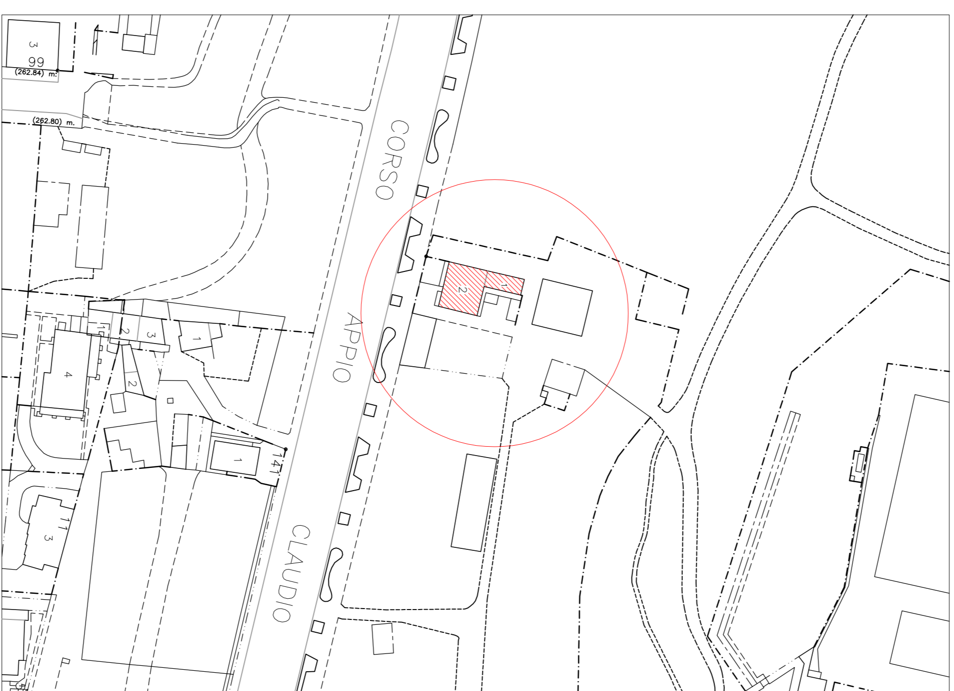
PLANIMETRIA IN SCALA 1:1000