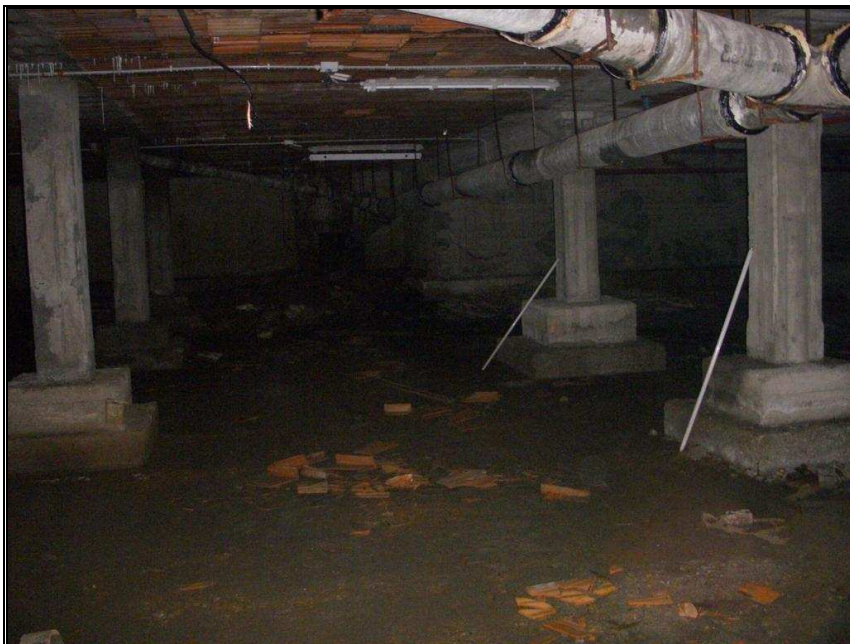
tubazioni scarico piano vespaio