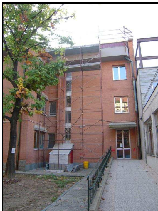
vista canna ex immondizia