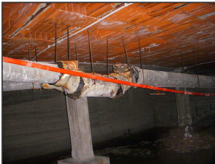
tubazioni scarico piano vespaio