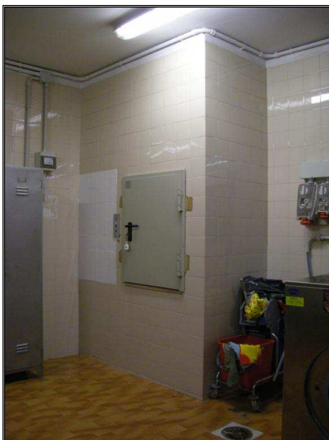
canna ex panni piano seminterrato lavanderia