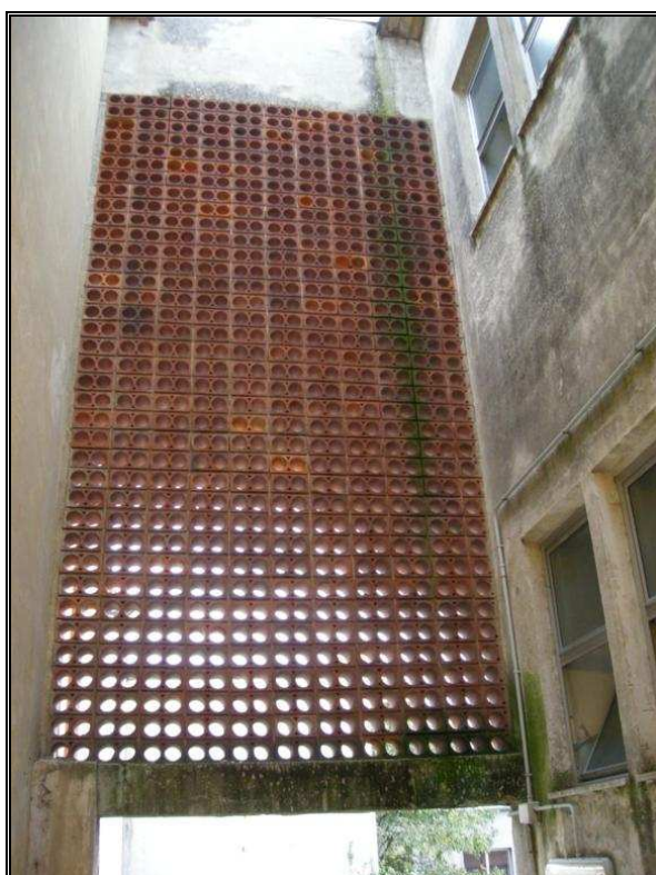
elemento frangisole da rimuovere