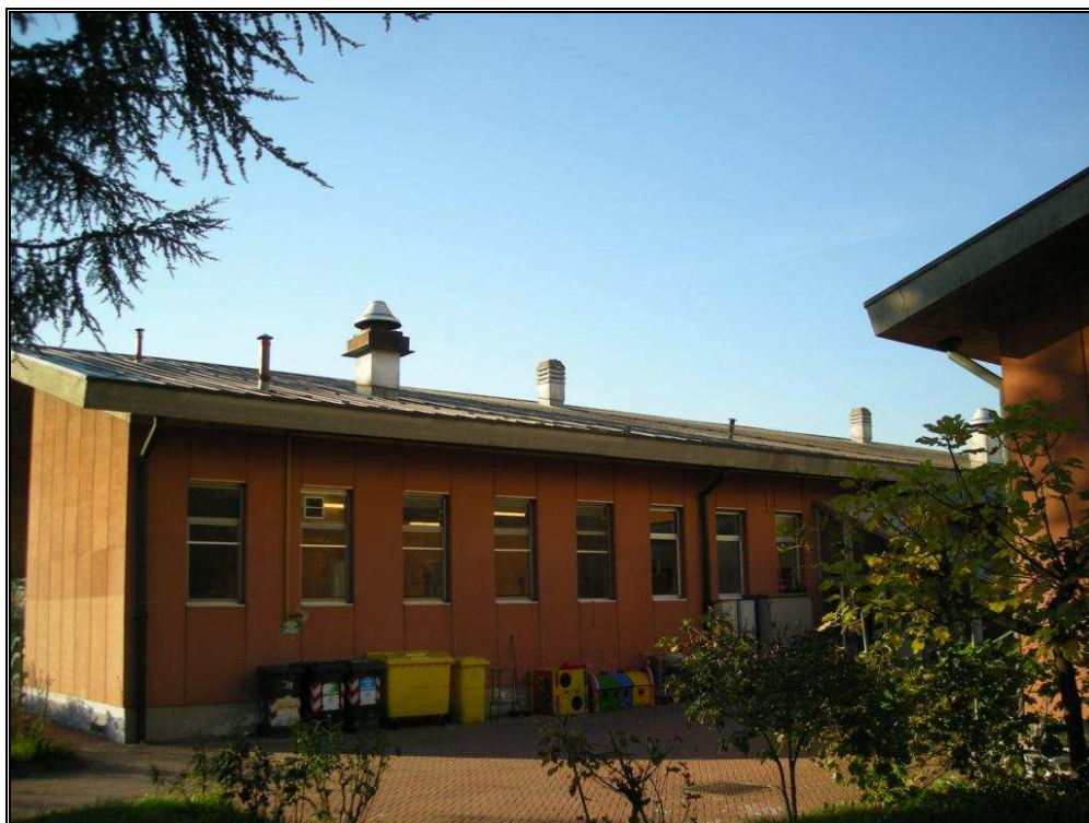
comignoli in copertura