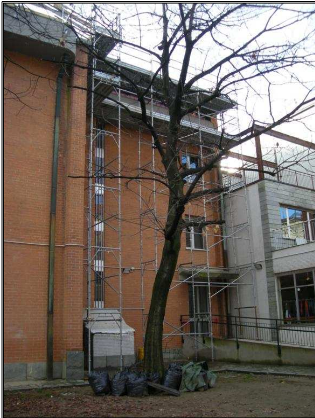
vista canna ex immondiziaegr