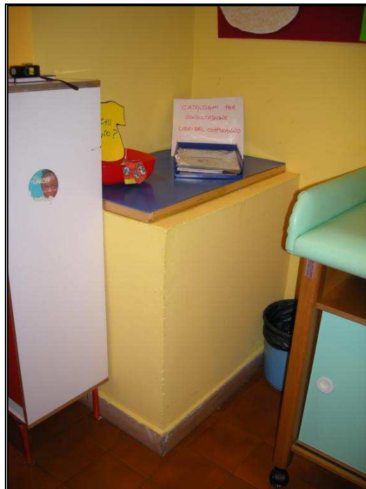
canna ex panni piano rialzato