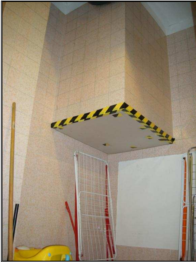
canna ex panni piano seminterrato