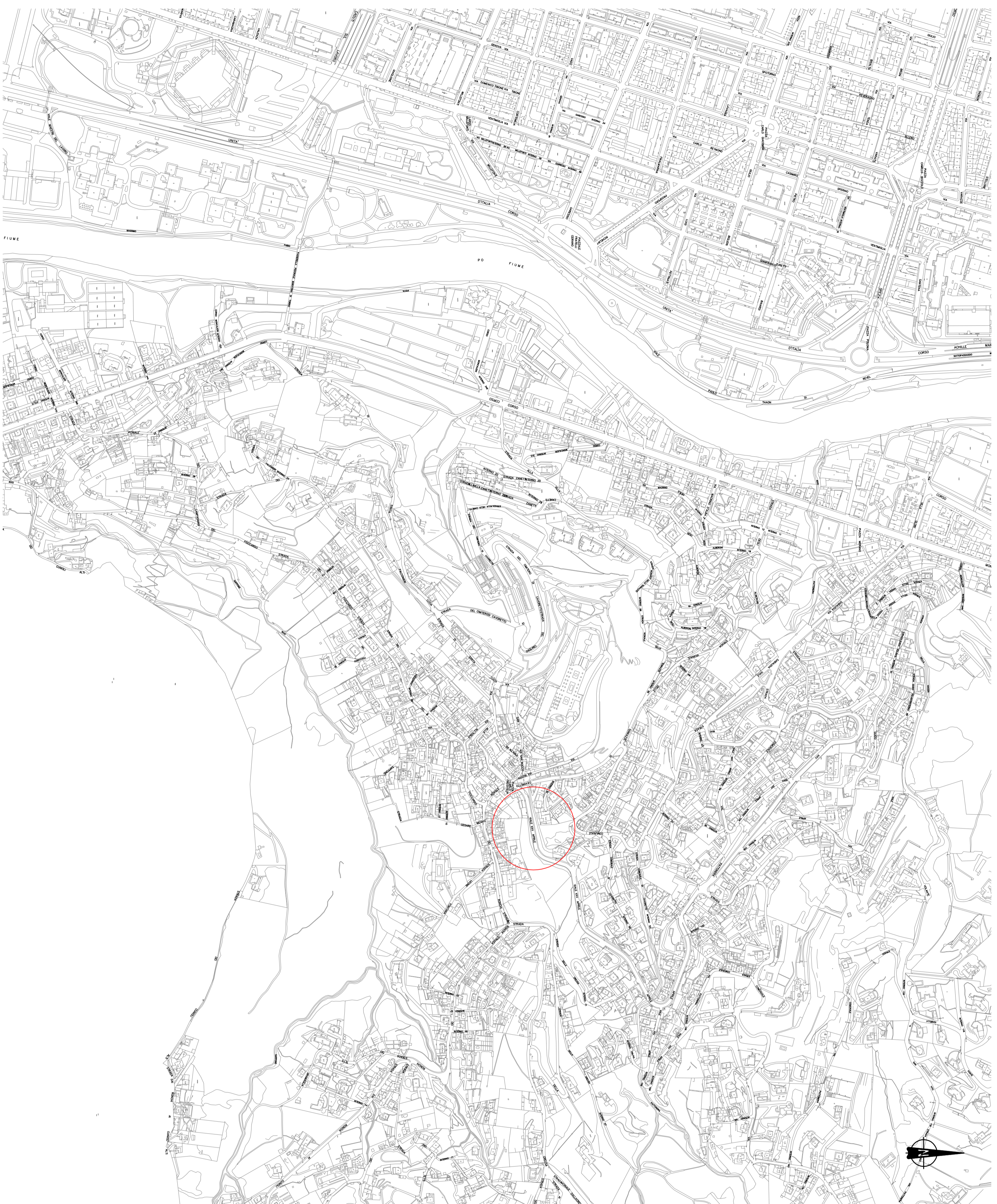
COROGRAFIA SCALA 1:5000

VICE DIREZIONE GENERALE INGEGNERIA DIREZIONE INFRASTRUTTURE E MOBILITÀ SERVIZIO PONTI, VIE D'ACQUA ED INFRASTRUTTURE