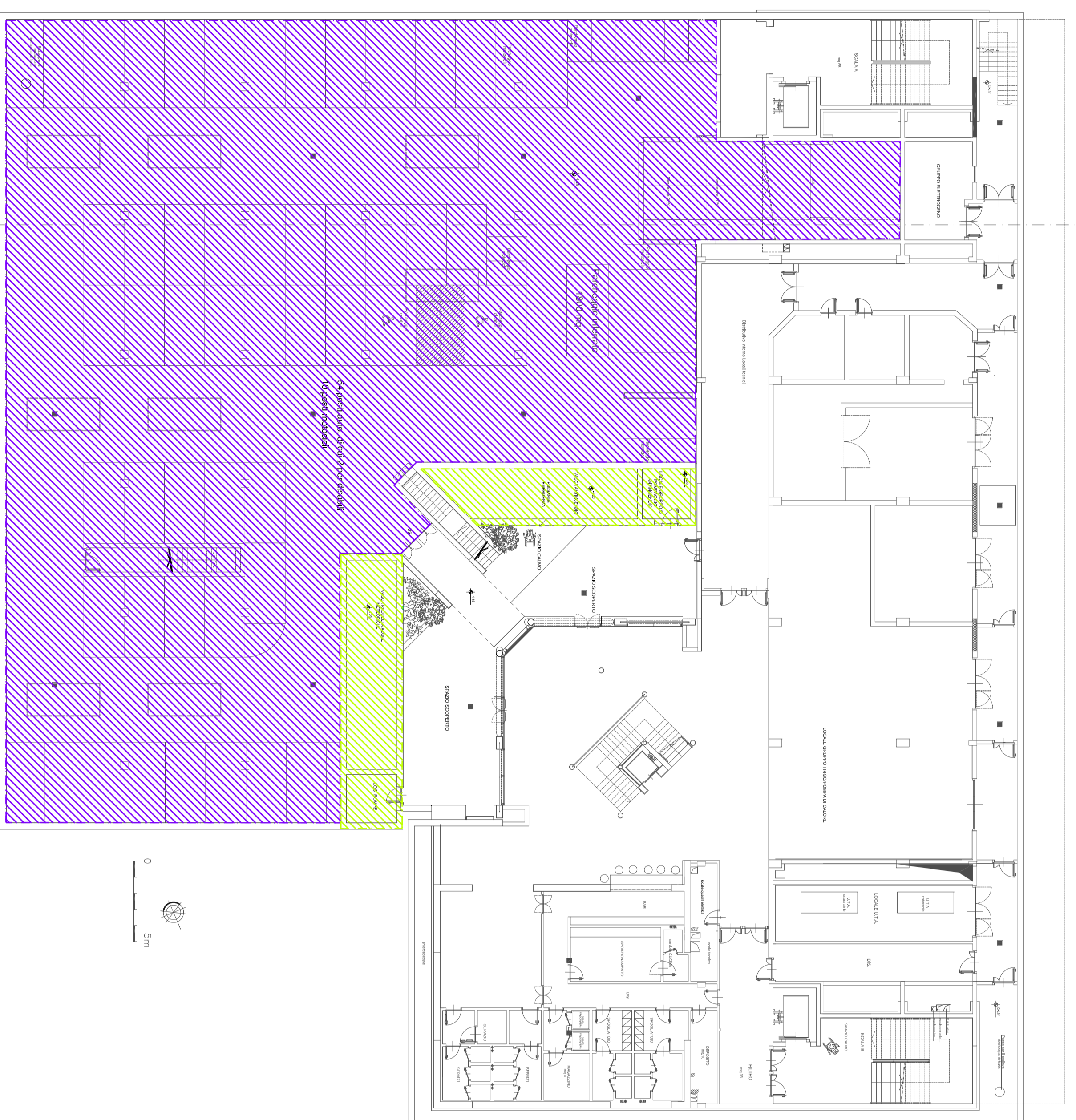
INDIVIDUAZIONE ATTIVITA' PIANO INTERRATO - scala 1:200

Area 3. Auditorium: attività 75.2.B di cui al d.P.R. 1 agosto 2011 n. 151