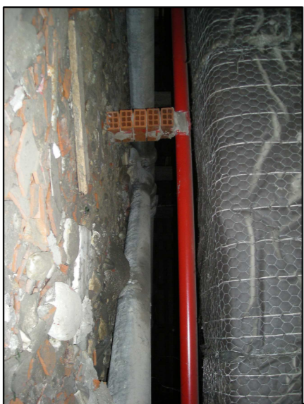
TUBAZIONI IN AMIANTO DA BONIFICARE