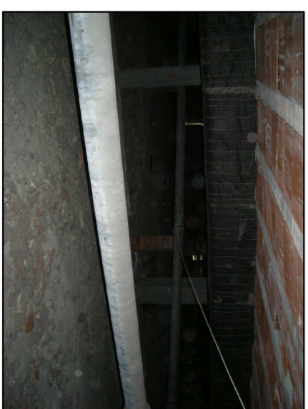
TUBAZIONI IN AMIANTO DA BONIFICARE