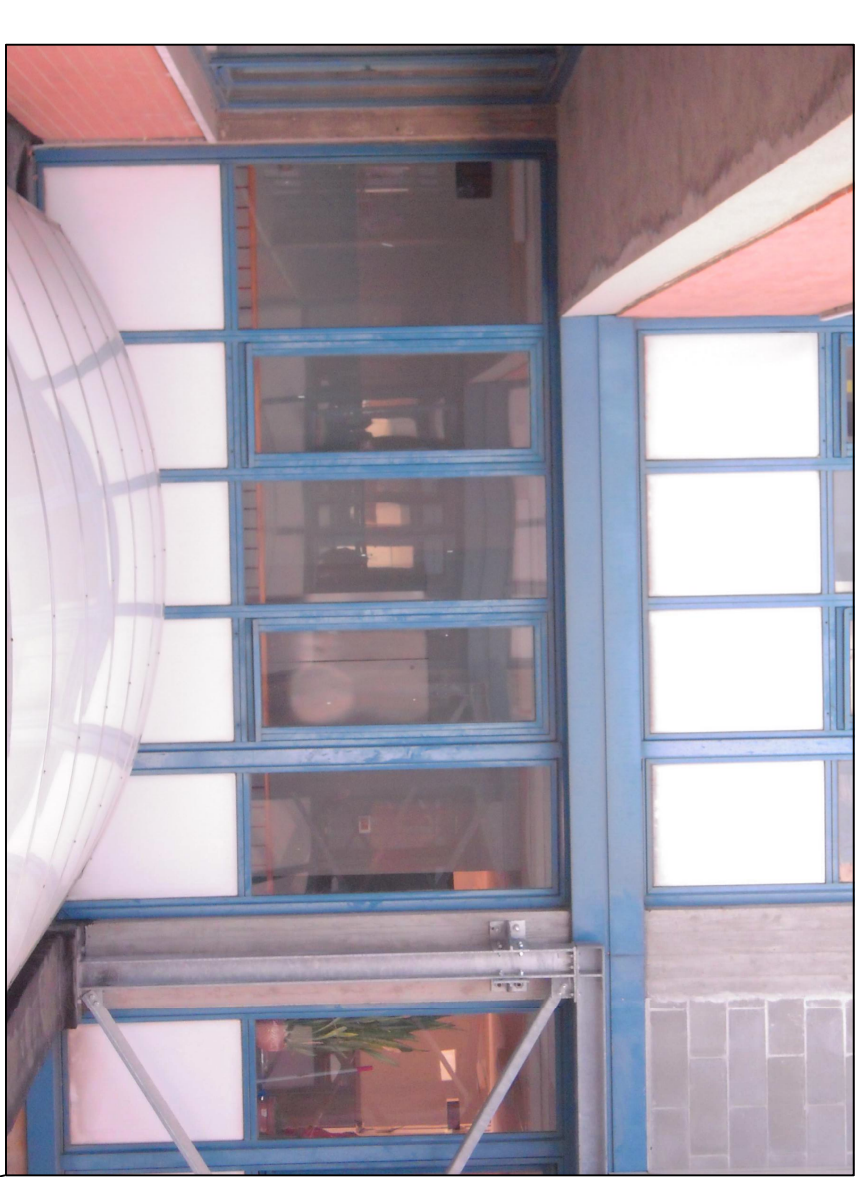
POZZO LUCE (PANNELLI CONTENENTI AMIANTO DA RIMUOVERE)