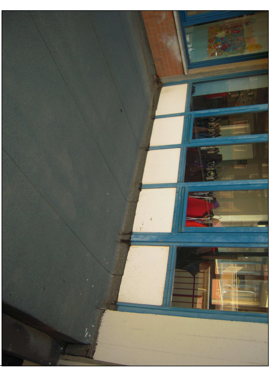
ZONA SCALA DI SICUREZZA (PANNELLI CONTENENTI AMIANTO DA RIMUOVERE)