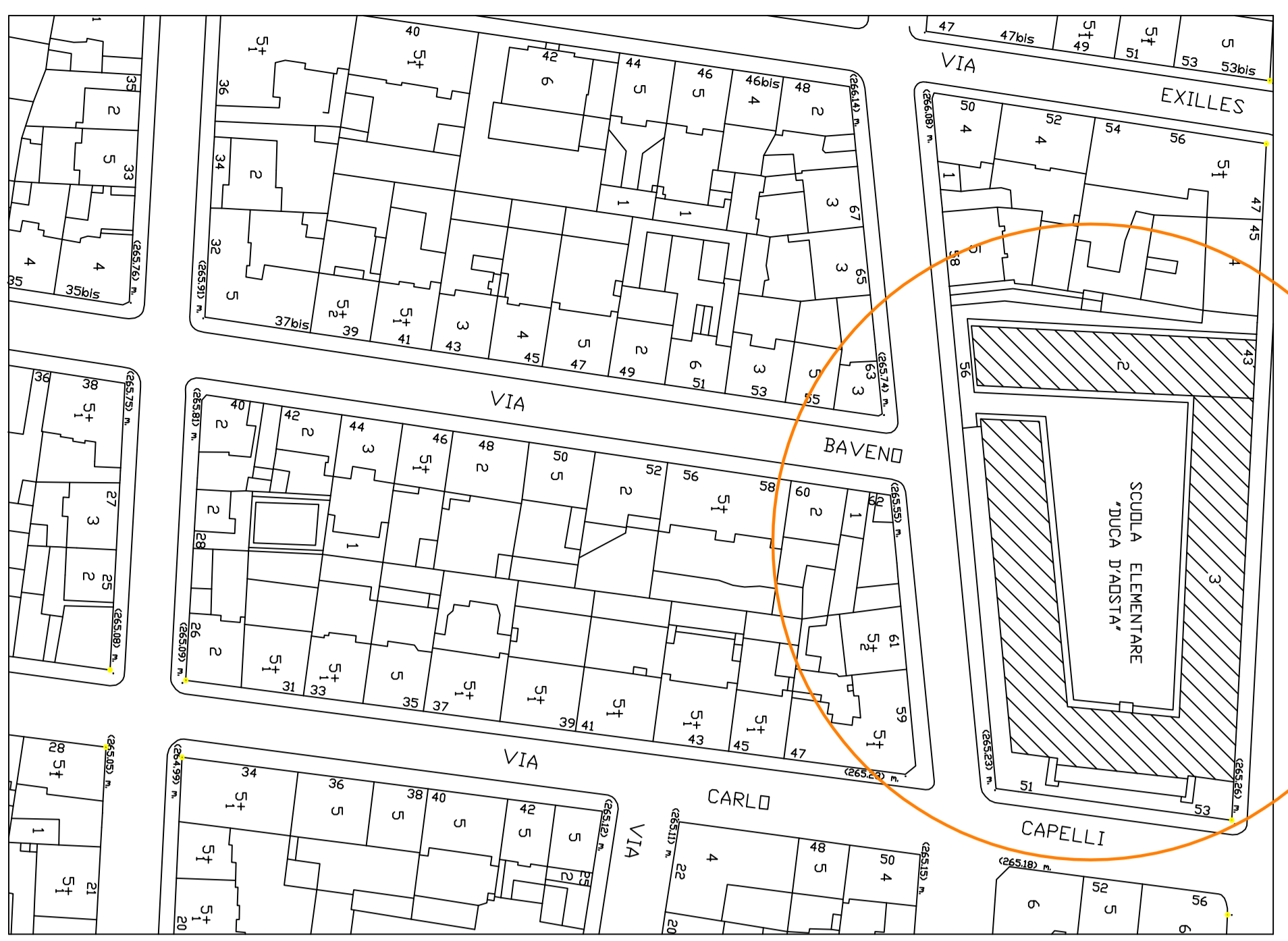
PLANNIMETRIA GENERALE SCALA 1:1000