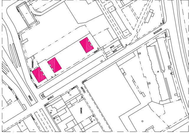
Estratto mappa - Scala 1/1000