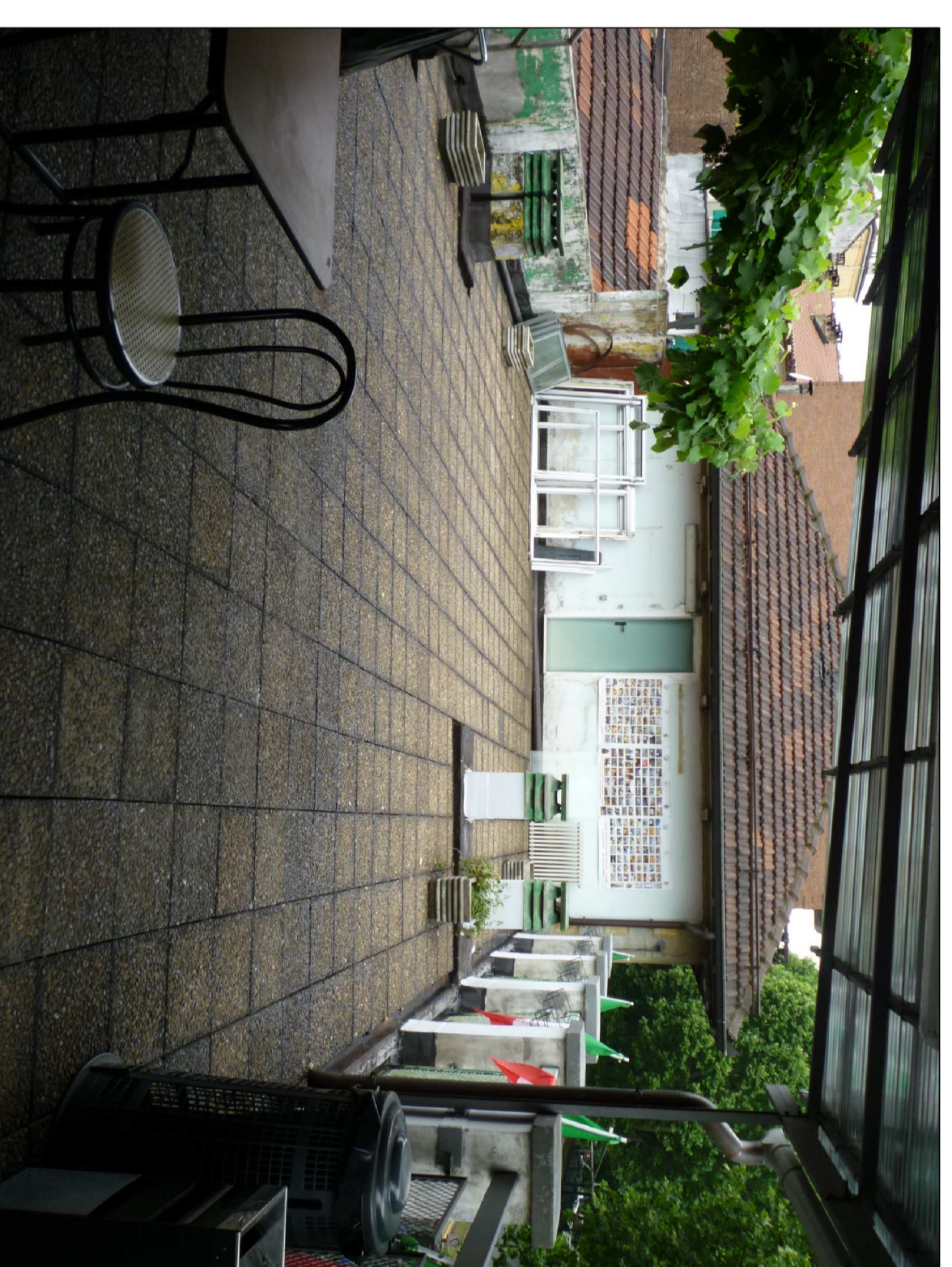
TETTO PIANO CON PAVIMENTO GALLEGGIANTE