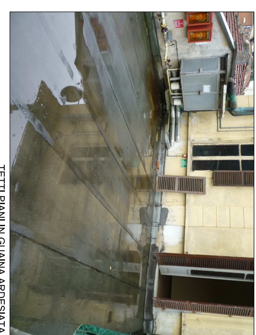
TETTI PIANI IN GIUNTA ADESIVATA