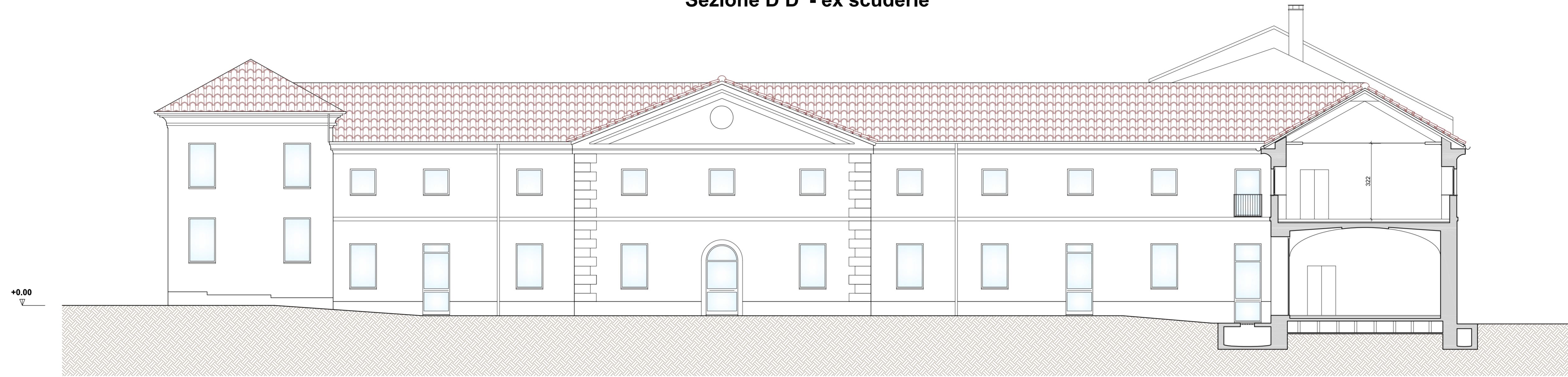
Sezione D D' - ex scuderie