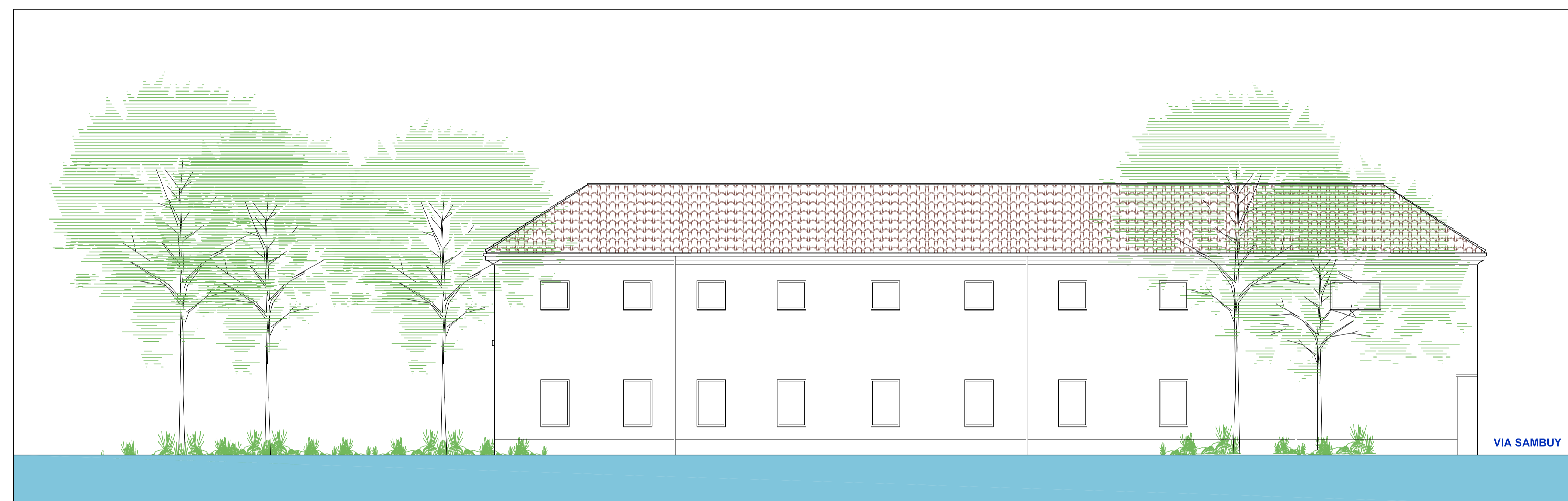
▽ ↳ Prospetto manica est, lato parco